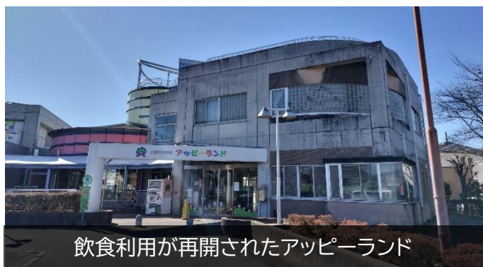
飲食利用が再開されたアッピーランド

コスト削減や効率化ではなく、市民サービスの向上の観点から行政改革は進められるべきです。この視点から質問を行っていきます。