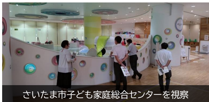
さいたま市子ども家庭総合センターを視察

子育てや福祉、生活困窮といった相談は、言うまでもなく先延ばしにすればするほど状況が悪化していきます。問題が起きたときに相談できるよう、平日日中のみ相談事業について、必要な方が相談できるよう、相談時間の平日夜間や休日への拡大を求めています。