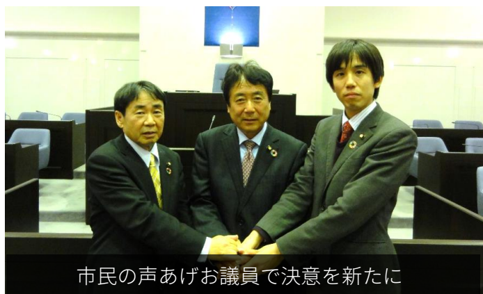
市民の声あげお議員で決意を新たに

仲間の議員と緊密に連携をしながら改革の最前線に立ち、改革を求める市民の声を議会の場に届け、まずは議員政治倫理条例の制定など不正を許さない制度づくりに向けて進んでまいります。