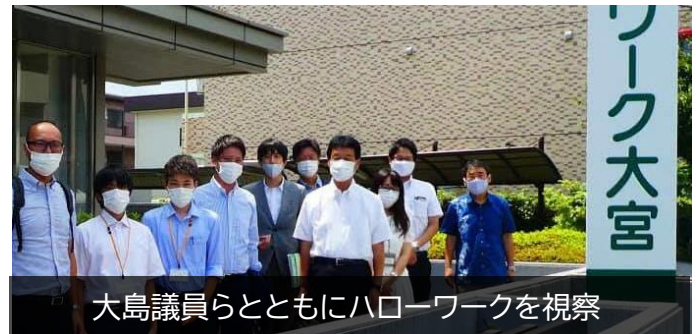
大島議員らとともにハローワークを視察

これを改善していくためには、働く市民の声を粘り強く市に対して伝えていく必要があります。自らの経験ももとにしながら、市民の声をもとにした提案を行っていきます。