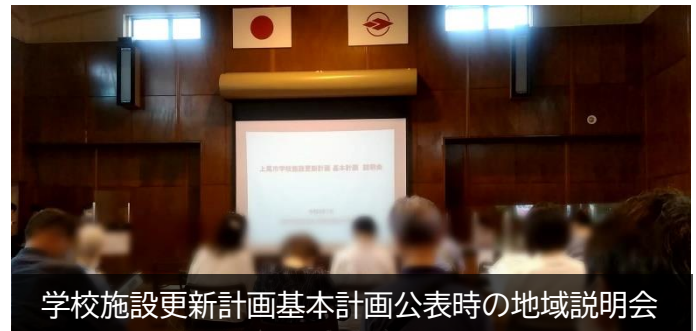
学校施設更新計画基本計画公表時の地域説明会

3月定例会では、「市民の声を聞く」ために上尾市としてすべきことを一般質問の場で提案していきます。