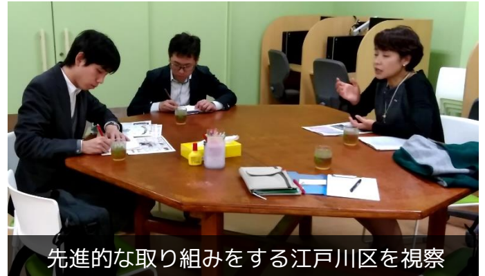
先進的な取り組みをする江戸川区を視察

この学習支援事業の対象拡大をスタートラインと捉え、子どもたちが未来をつくるためのサポートができるような仕組みづくりを進めていきます。