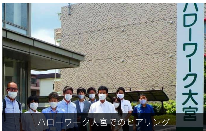
ハローワーク大宮でのヒアリング

今回のヒアリングを受けて、改めて上尾市が労政分野の現状把握や対策に積極的に取り組む必要があると感じました。9月議会ではこの点について質していきたいと思えます。